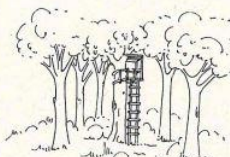
Tipologia su albero