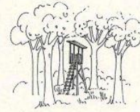
Tipologia autoportante, di altezza non superiore agli alberi limitrofi