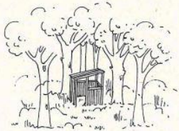
Tipologia parzialmente aperta