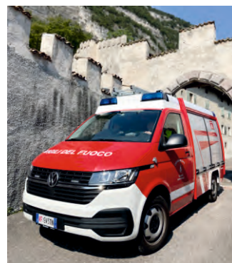
Un nuovo mezzo per i Vigili del Fuoco