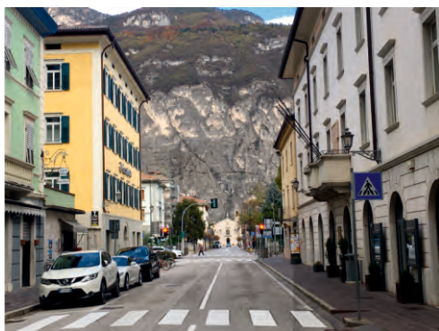
Bonus da 25 euro per ogni cittadino

porta a porta anche per quanto riguarda il rifiuto organico. L'obiettivo è garantire una raccolta ordinata, senza conferimenti abusivi o errati, con maggiore decoro urbano. Su decisione dell'Amministrazione comunale, alcune di queste isole ecologiche, in particolare quelle presenti in centro storico, saranno semi-interrate, per coniugare il minor impatto possibile con una capacità di raccolta maggiore. Nelle pagine interne di questo notiziario comunale, ampi servizi sulle NOVITÀ all'orizzonte.