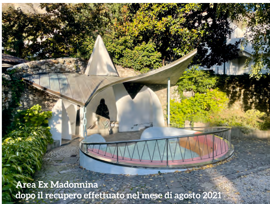
Area Ex Madonnina dopo il recupero effettuato nel mese di agosto 2021

Ringraziando ancora tutto l'Ente Gestore, il personale scolastico e i nostri supporters riponiamo nei bambini le nostre speranze per un mondo pieno di sogni e libertà.