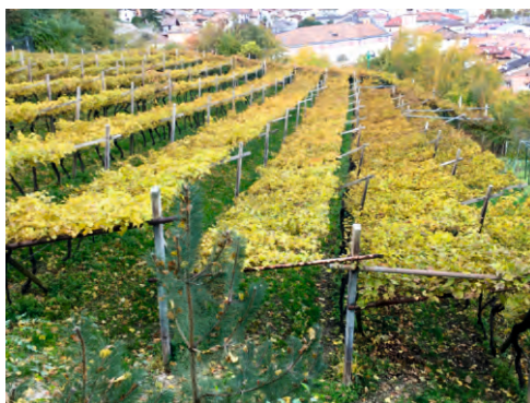
Vini e Territorio: il Teroldego con i rossi spagnoli