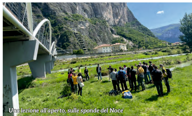
Una lezione all'aperto, sulle sponde del Noce