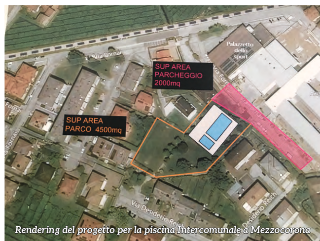
Rendering del progetto per la piscina intercomunale a Mezzocorona

vasca piccola per bambini. Una vasca anche all'esterno. «La piscina dovrà funzionare tutto l'anno. Sarà in una posizione strategica anche per gli utenti che arrivano in bici, con la ciclabile della Galletta quasi ultimata, a piedi o con il treno, grazie alla stazione a 5 minuti», ha anticipato Hauser.