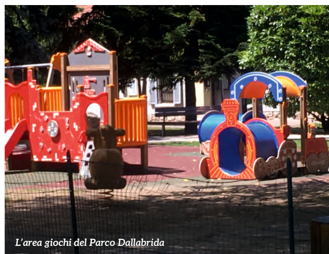
L'area giochi del Parco Dallabrida

Sul sito e sulle pagine social del Comune di Mezzolombardo verranno pubblicate tutte le proposte.