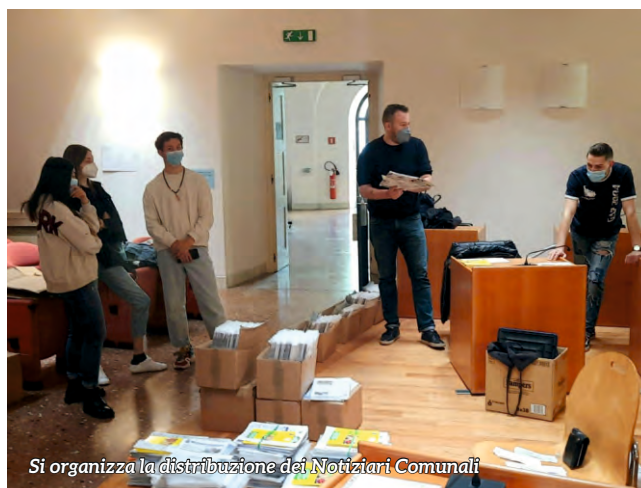
Si organizza la distribuzione dei Notiziari Comunali