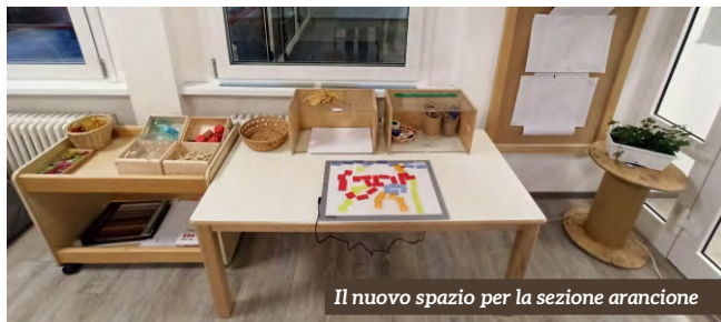
Il nuovo spazio per la sezione arancione

Lo spazio nella scuola dell'infanzia non è un semplice contenitore di attività, ma un vero e proprio «terzo educatore» dopo l'insegnante e il gruppo dei pari. L'organizzazione degli ambienti interni riveste un ruolo fondamentale nel processo educativo e nell'esperienza quotidiana dei bambini. La cura degli ambienti riflette la qualità del progetto educativo e influenza significativamente il benessere e lo sviluppo dei bambini. Gli spazi nella scuola dell'infanzia sono fondamentali nel percorso pedagogico dei bambini. Come noto, infatti, l'apprendimento di questi ultimi viene influenzato, oltre che dal metodo didattico, anche dall'ambiente che li circonda e dagli stimoli che essi ricevono. Gli spazi, a scuola, sono educazione e crescita. Del resto, una disposizione degli spazi che non consenta ai bambini un utilizzo libero di ciò che li circonda, difficilmente potrà favorire l'organizzazione spontanea e autonoma di giochi e attività.