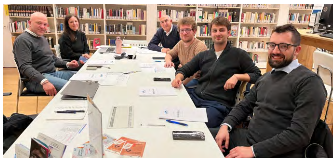
La commissione notiziario al lavoro in Biblioteca