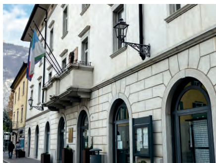
La nuova giunta e il nuovo consiglio pag. 2

A tutti i nostri concittadini i migliori Auguri per le prossime festività.