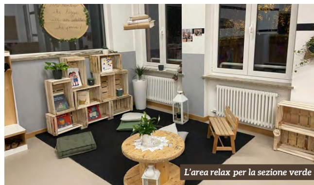
L'area relax per la sezione verde

Così, quando si elaborano spazi ben organizzati, ricchi di proposte di attività, i bambini