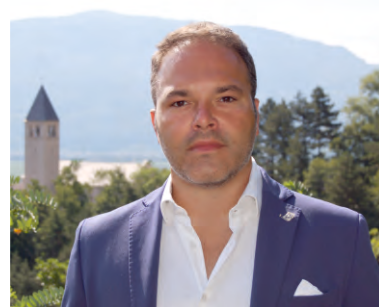
Christian Girardi - Sindaco

In questi primi mesi del 2023 si stanno concretizzando molte delle cose che erano contenute nel nostro programma elettorale, che, come sempre, deve rimanere al centro della nostra agenda di governo.