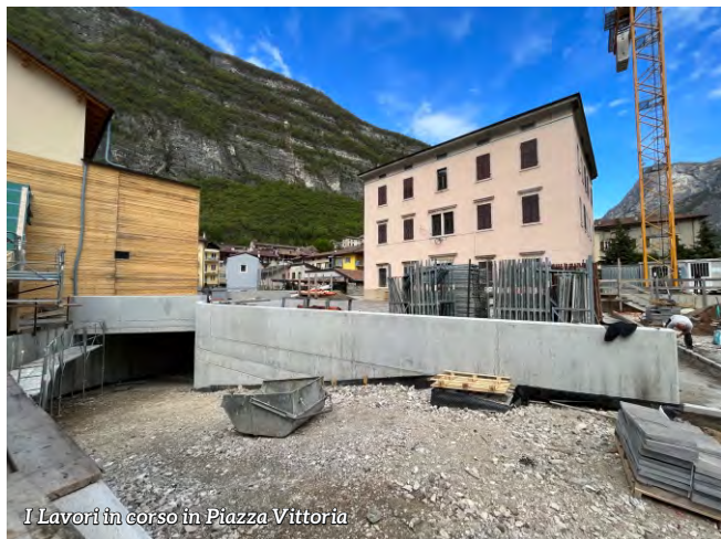
I Lavori in corso in Piazza Vittoria

Queste opere impegneranno molto la nostra struttura comunale che dovrà cercare di metterle a terra il prima possibile. Grazie a tutti gli uomini e le donne che lavorano con impegno in Comune, nella giungla burocratica della nostra epoca. Per loro ci sarà un impegno forte nei prossimi anni, ma sono sicuro del ringraziamento sincero della nostra intera comunità.