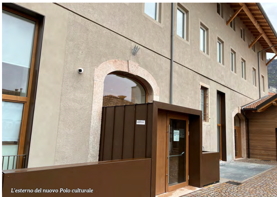
L'esterno del nuovo Polo culturale