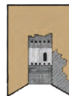
ASSOCIAZIONE CASTELLI DEL TRENTINO

A cura del Direttivo Associazione Castelli del Trentino