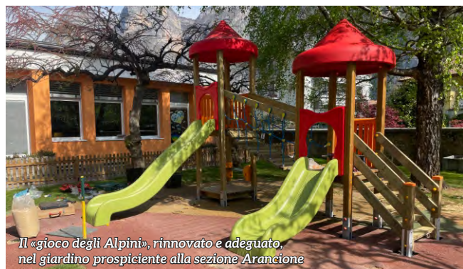
Il «gioco degli Alpini», rinnovato e adeguato, nel giardino prospiciente alla sezione Arancione

Il 20 dicembre 2022, finalmente in presenza dopo la pandemia, i soci della scuola dell'Infanzia di Mezzolombardo si sono incontrati per la consueta assemblea sociale. Come da statuto, la presidente ha relazionato su quanto portato a termine per l'anno solare 2022, un anno vissuto a metà tra le restrizioni pandemiche via via più leggere. Numerosi sono stati i lavori strutturali completati, tra cui le controsoffittature e la pavimentazione di due sezioni nonché gli adeguamenti ai bagnetti dei bambini, in tutte le sezioni. Ulteriori risorse sono state investite nei